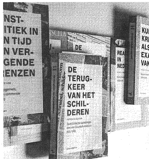
Delen van 'Kunstkritiek in Nederland 1885-2015'.