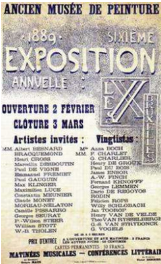
Les XX. Affiche van de tentoonstelling van 1889

Net als andere delen begint het boek met een inleidend, beschouwd artikel van de samensteller. Hierin schetst Tibbe de kunstkritiek in de jaren 1885-1905 tegen de achtergrond van de tijd. De kunstkritiek in de jaren 1880 ontwikkelde zich tegen de achtergrond van de afschaffing van het dagbladzegel in 1869, een fiscale heffing die het uitgeven van kranten en periodieken erg duur maakte. Na 1869 was deze belemmering weggenomen. De stijging van de