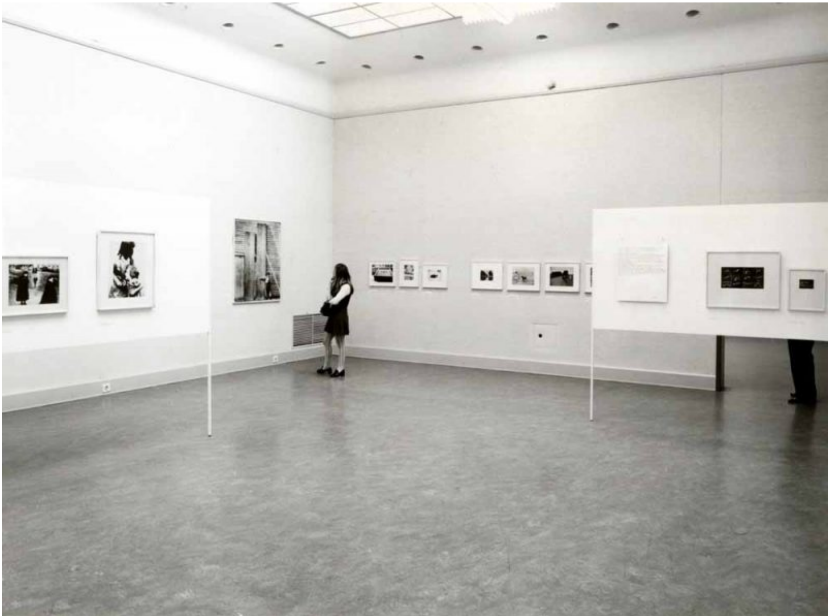
De tentoonstelling The Photographers Eye, Van Abbemuseum Eindhoven 1970.

Ook collectors items (maar hier niet genoemd) zijn de tentoonstellingsboekjes die de Nederlandse Kunststichting en Bureau Beeldende Kunst Buitenland eind jaren zeventig en begin jaren tachtig maakten in opdracht van het Ministerie van WVC. WVC zette zich in voor de promotie van fotografie en richtte zich daarbij zowel op documentaire en journalistieke fotografie als beeldende kunst waarbij fotografie als medium werd gebruikt.