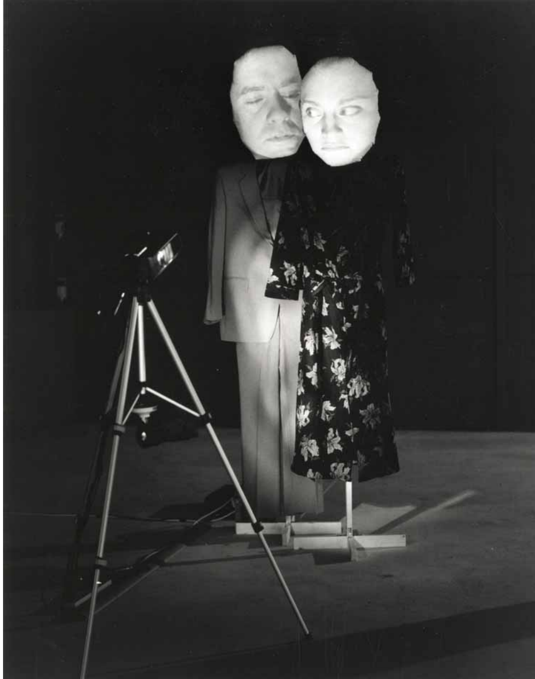
De video-installatie Autochthonus Alien van Tony Oursler in Het Van Abbemuseum in Eindhoven, 1995.